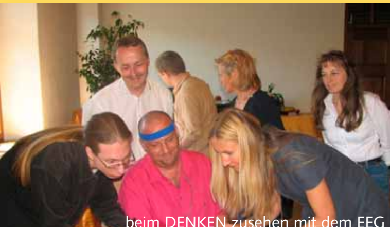
beim DENKEN zusehen mit dem EEG

Sie lernen die neuesten Tranceinduktionen von Richard Bandler aus DHE und NHR, vertiefen den Umgang mit dem Miltonmodell auch im Alltag z.B. im Verkauf!