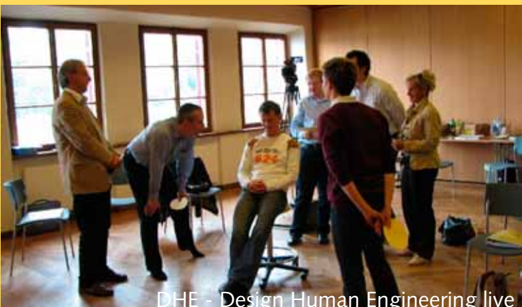
DHE - Design Human Engineering live

Weitere Informationen zu „trance port your id'eas“ finden Sie in der separaten Infobroschüre.